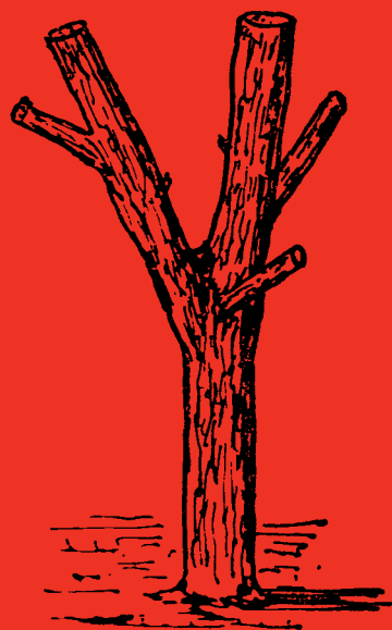
FIGURA – CENTRE DE RECHERCHE SUR LE TEXTE ET L'IMAGINAIRE (ANTENNE CONCORDIA) UNIVERSITÉ CONCORDIA 1455, boulevard De Maisonneuve Ouest Montréal (Québec) H3G 1M8 514-848-2424 #7572 figura@alcor.concordia.ca

CE COLLOQUE A REÇU LE PRÉCIEUX SOUTIEN FINANCIER DES ORGANISMES SUIVANTS : FIGURA – CENTRE DE RECHERCHE SUR LE TEXTE ET L'IMAGINAIRE (ANTENNE CONCORDIA ET SITE UQAM) CONSEIL DE RECHERCHES EN SCIENCES HUMAINES DU CANADA VICE-RECTORAT À LA RECHERCHE ET AUX ÉTUDES SUPÉRIEURES DE L'UNIVERSITÉ CONCORDIA FACULTÉ DES ARTS ET DES SCIENCES DE L'UNIVERSITÉ CONCORDIA DÉPARTEMENT D'ÉTUDES FRANÇAISES DE L'UNIVERSITÉ CONCORDIA